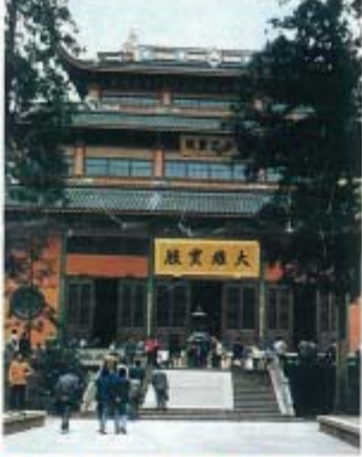
▲中国の風物には歴史の重さが