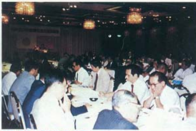
▲豪雨の中、総会は盛會裡に終了

本協議会通常総会を、七月三十日長崎グランドホテルにおいて開催した。総会に先立ち理事會が開催され、五十四年度事業の報告、五十五年度事業計画などについて、審議が行われた。