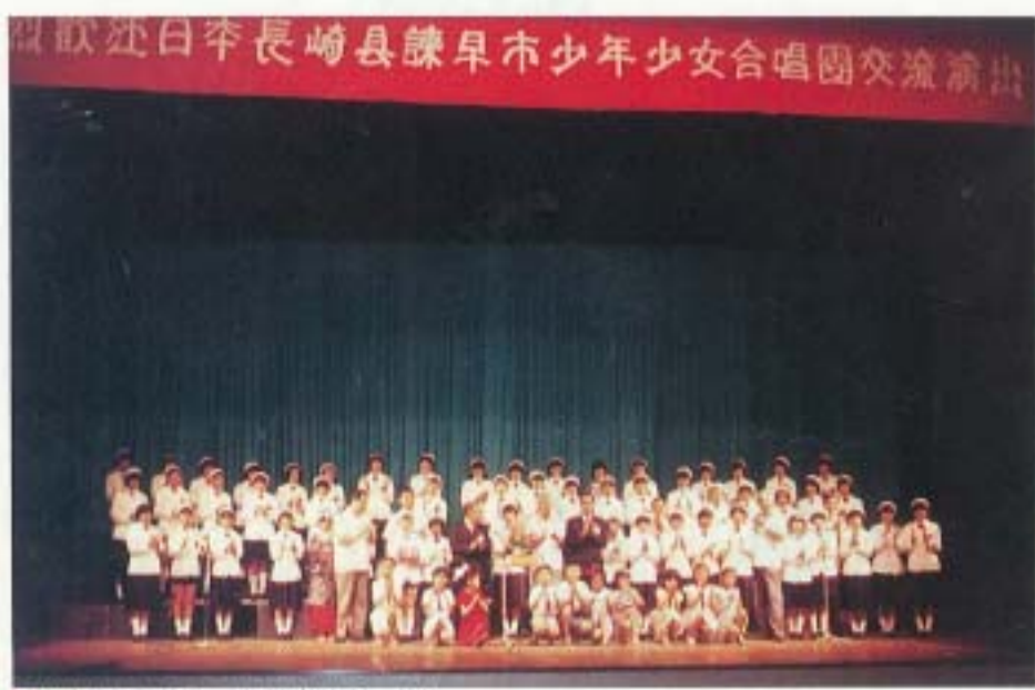
▲美しいハーモニーに聴衆はうっとり