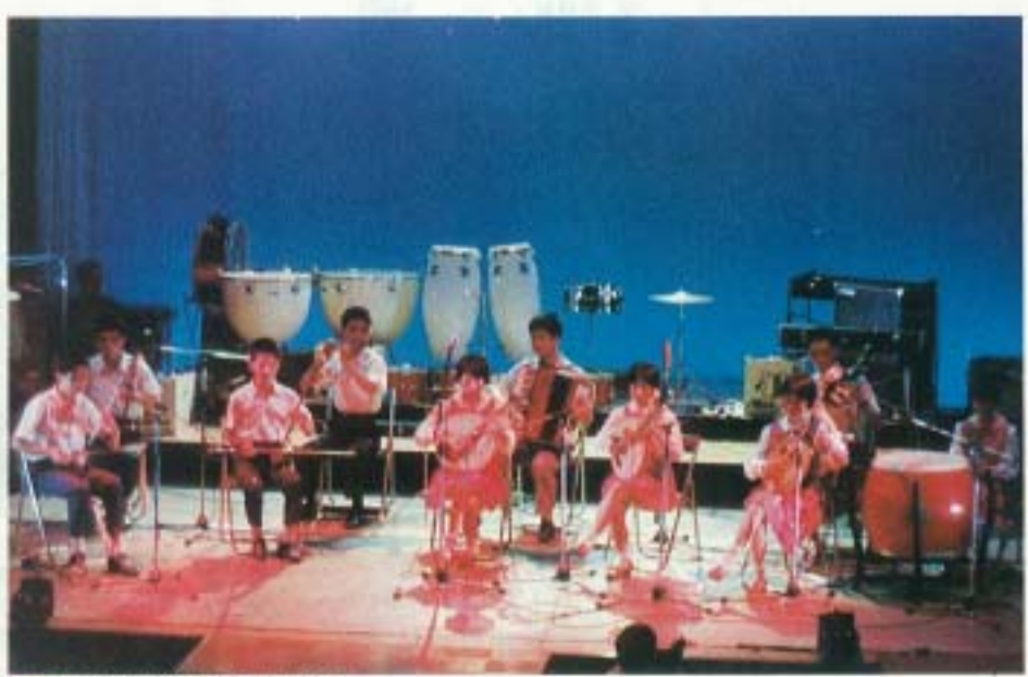
▲中国古来の楽器を見事に演奏