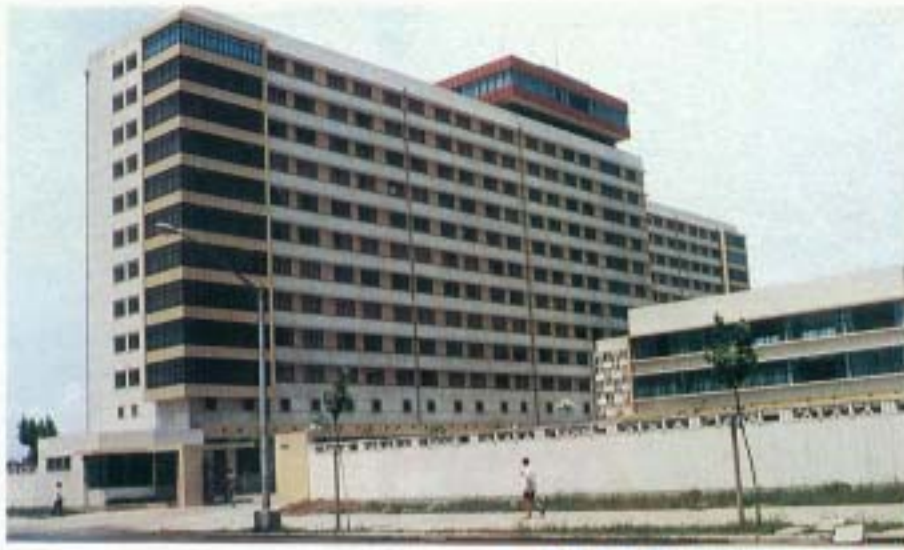
▲上海宝山賓館は14階建の近代ホテル

本協議会と上海市人民政府外事弁公室との間で進められていた、水上ホテル設置合弁事業は、中国側の環境問題から見送りになった。設置予定地の黄浦江が上海の水道として利用されており、ホテル設置によりこの水源が汚染される恐れがあるとの理由。上海市人民政府外事弁公室と、本協議会との間で設置についての合意は取りつけていたが、同外事弁公室に同政府環境衛生管理処がこの計画に持ったをかけたことから、同政府内部において調整が何回となく行われていた。本協議会とし