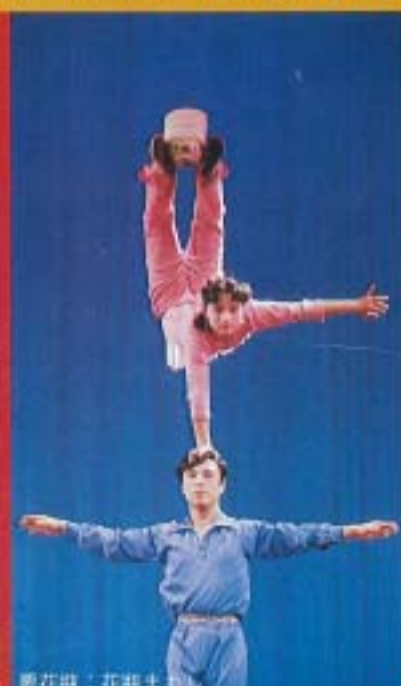
要花瓶：花瓶まわし