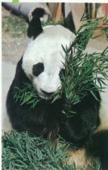
▲ササの葉は大好物

パンダは雑食性の動物。好物の笹のほかに、大豆やとうもろこしの粉で作った、まんじゅうやリンゴ、サトウキビや、キャンデーなど甘いものも大好き。一日になんと六七キロ食べる。