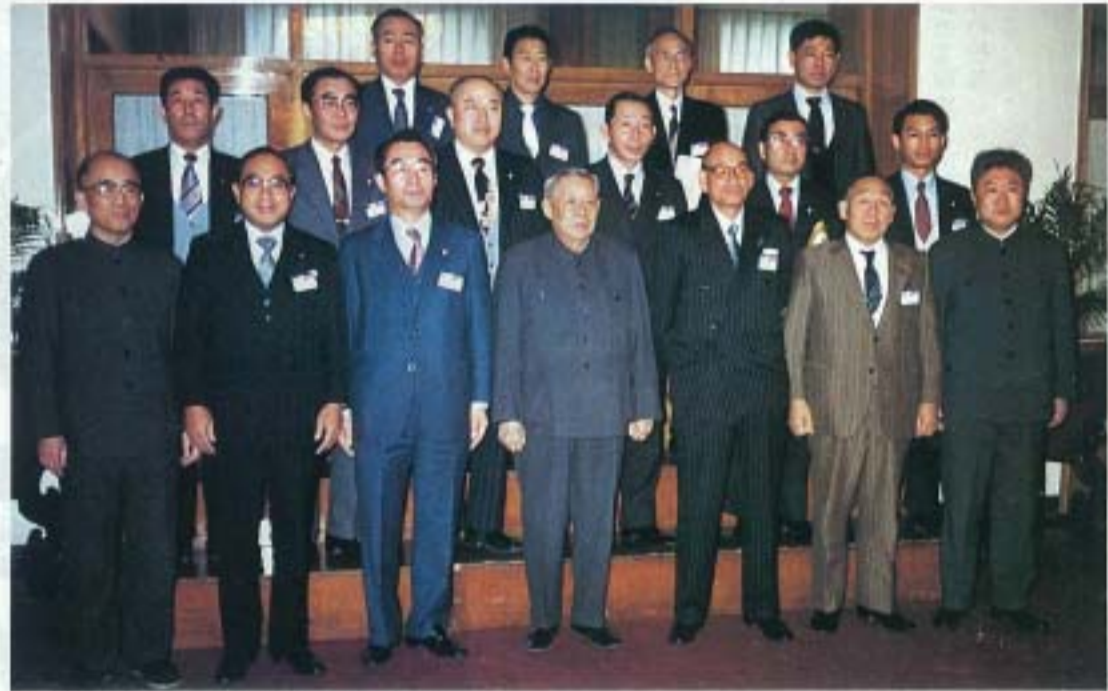
▲副会長を中心に中国側代表と訪中代表団一行