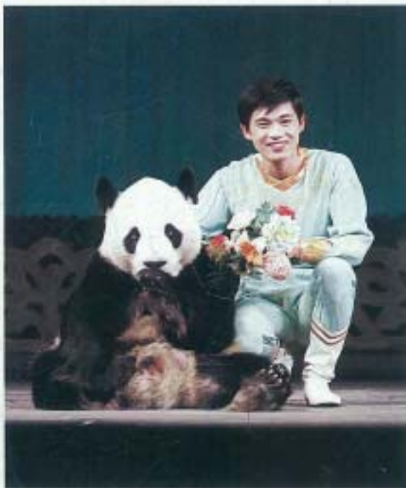
▲ウェイウェイ君のご挨拶