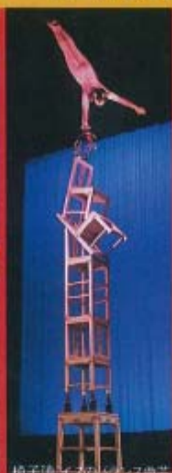
椅子陣：イスのバランス曲芸