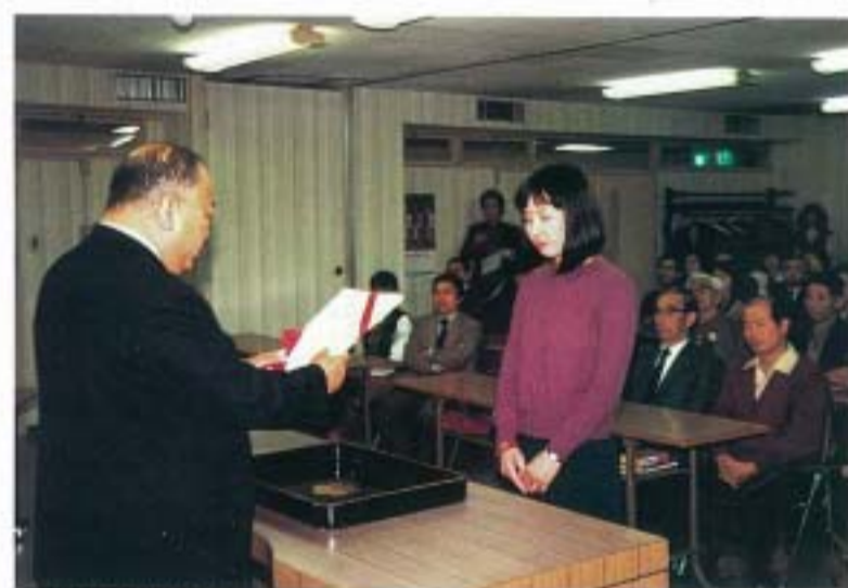
▲中国語講座開講式

於 長崎市立山町 長崎県立ユースホステル 於 佐世保市中央公民館 佐世保市には、本協議会佐世保支部もあり、佐世保市にも、中国語講座開講の要望も強いところから、特に佐世保地区での中国語講座を開催することにしたものである。