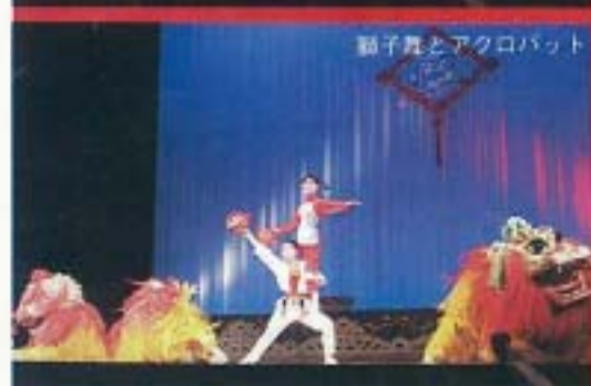
獅子舞とアクロバット