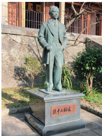
孫文銅像メンテナンス後

今回、長崎県上海市友好交流関係樹立25周年を記念し、孫文銅像の補修及びメンテナンスを行いました。