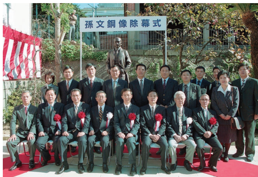
孫文銅像除幕式 2001（平成13）年11月19日