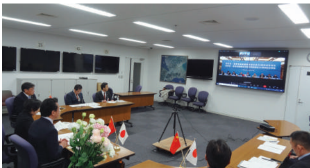
諫早市—漳州市とのオンラインでの交流会