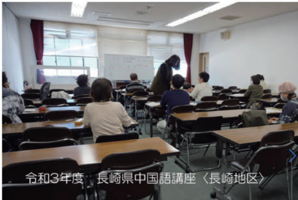
令和3年度 長崎県中国語講座〈長崎地区〉

第23回ながさき国際協力・交流フェスティバル（オンライン開催）にかかるデジタルコンテンツ（協議会活動写真）を提供し、（公財）長崎県国際交流協会の公式ホームページにて中国語講座を紹介