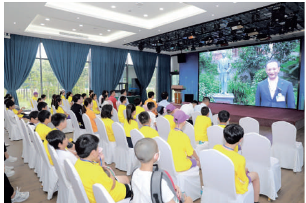
長崎県上海市友好交流関係樹立25周年記念事業 日中青少年交流活動東方緑舟開会式