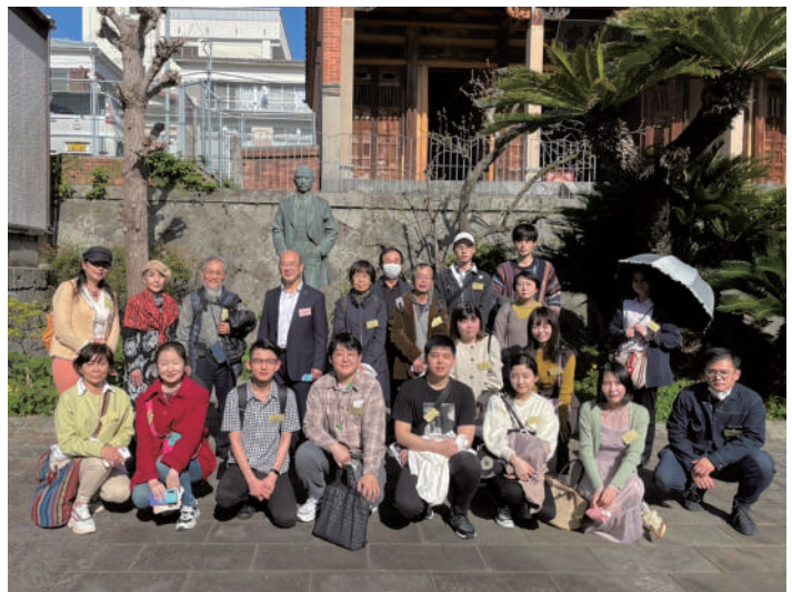
孫文銅像（福建会館内）

コース：長崎孔子廟中国歴代博物館～長崎市旧香港上海銀行長崎支店記念館・長崎近代交流史と孫文・梅屋庄吉ミュージアム～唐人屋敷界限～福建会館（孫文銅像）～湊公園