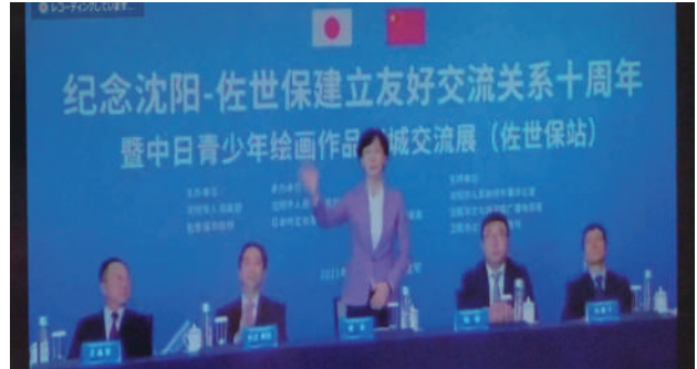
佐世保・瀋陽友好交流都市提携10周年記念式典

第23回ながさき国際協力・交流フェスティバル（オンライン開催）にかかるデジタルコンテンツ（協議会活動写真）を提供し、（公財）長崎県国際交流協会の公式ホームページにて中国語講座を紹介