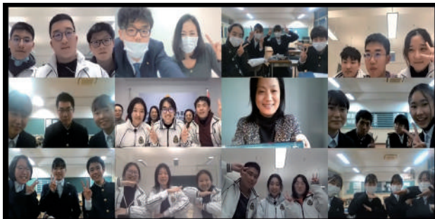
ICT（情報通信技術）を活用したオンライン交流 （長崎県立長崎東高等学校と上海外大附属高校）