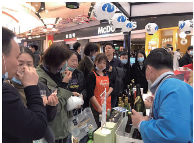
長崎県・湖北省友好交流10周年記念 「武漢ジャパンプランド」に長崎県総合ブースを出展