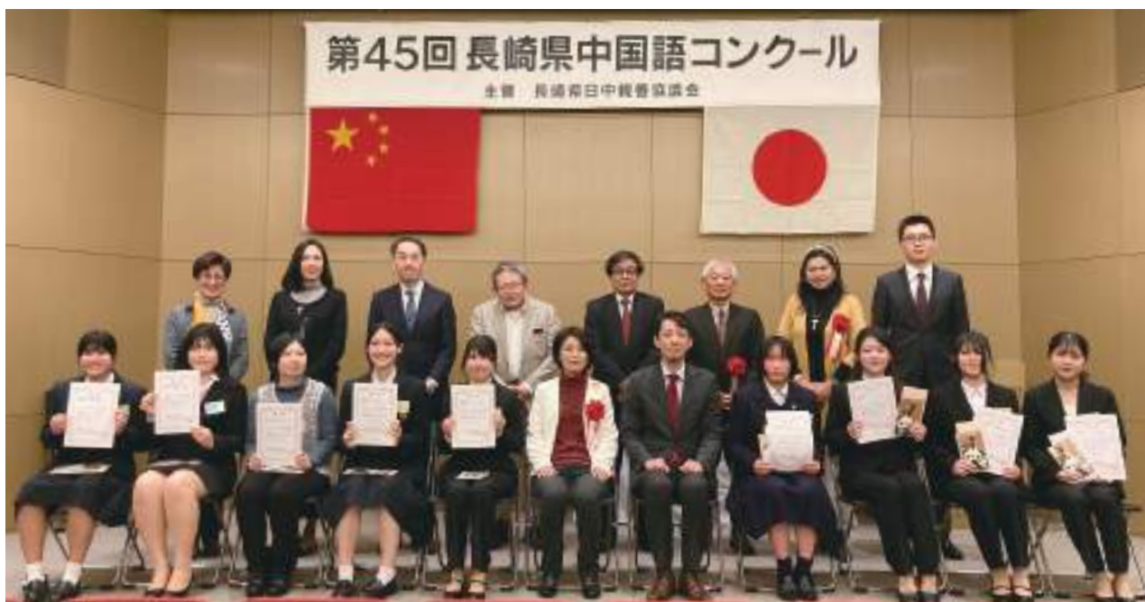
受賞者のみなさま