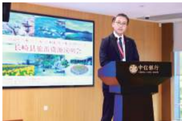
長崎県観光説明会