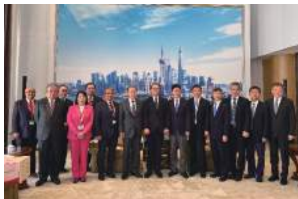
中国東方航空と訪問団との集合写真