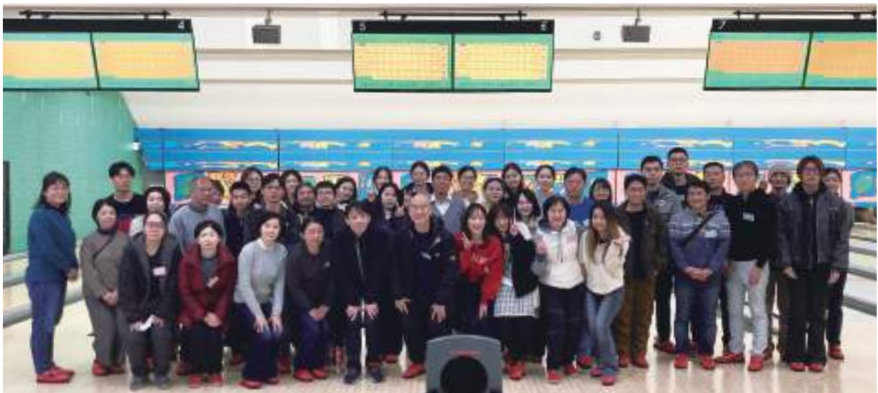
令和6年度「中国からの留学生との交流会」～ボウリング大会～