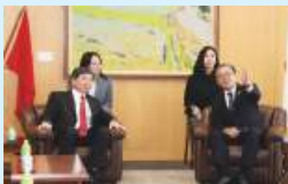
周祖翼福建省書記との会見

また、7 月 29 日(月)から 7 月 31 日(水) 3 日間の日程で、福建省写真展が県庁で開催され、長崎県と福建省との友好交流に関する写真や福建省の文化作品の展示が行われました。