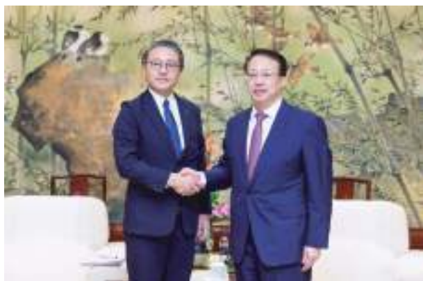
龔正上海市長との会見

長崎～上海定期航空路線は、1979年(昭和54年)9月に東京、大阪に続き日本で3番目に開設されて以来45年間、両地域を結ぶ重要な懸け橋として運航されており、今後とも、定期航空路線を活用して上海市との交流が更に活発になることが期待されます。