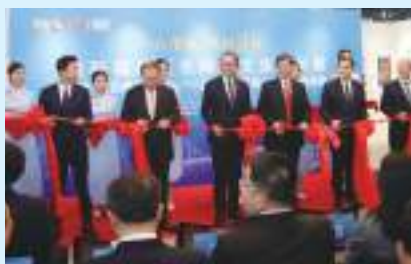
福建省写真展開幕セレモニー