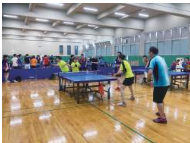
熱戦を繰り広げる選手たち